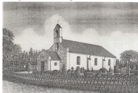
Tegning af Frederiks kirke fra 1942.

I 1766 fik kolonisterne deres egen kirke. Den fik navnet Frederikskirken og blev opført på den øde og helt træløse hede nøjagtigt midt imellem Grønhøj og Havredal. Beboerne i begge byer ville nemlig have kirken til at ligge i netop deres by, og der blev derfor valgt den salomoniske løsning at lægge den lige midt imellem. Her i kirken blev der udelukkende prædikeret på tysk indtil 1856, herefter hver anden søndag på tysk og hver anden på dansk. Først fra 1870 blev der udelukkende prædikeret på dansk. I dag er efterkommerne af de tyske kolonister for længst blevet danske, men på gravstenene på Frederiks kirkegård er der stadig flest tyskklingende navne. Frederikskirken gav navn til byen Frederiks, der først opstod i 1906 omkring stationsbygningen, som blev opført midt på den nøgne hede, da Alhedebanen mellem Viborg og Herning blev anlagt.